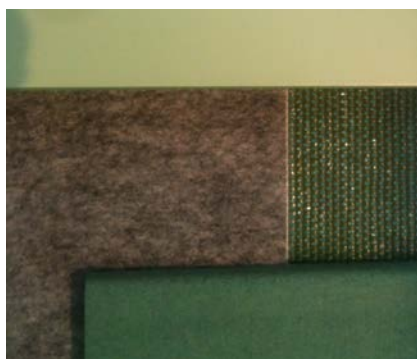
Filt, Mdf, möbeltextil (exempel)