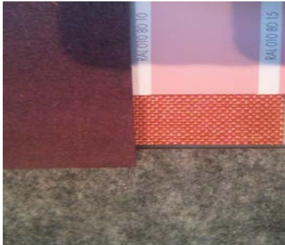
Filt, Mdf, möbeltextil (exempel)