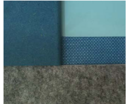
Filt, Mdf, möbeltextil (exempel)